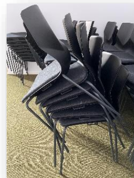
Sådan må stolene ikke stables