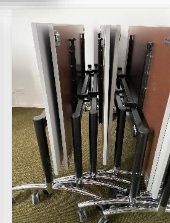
Sådan skal borde og stole stables og stilles i foredragssalen

Ved booking af lokalet, send mail til vejbib@vejen.dk - oplys os om hvem du er/forening mm., antal deltagere, dato og tidsrum, kontaktperson og telefon nummer